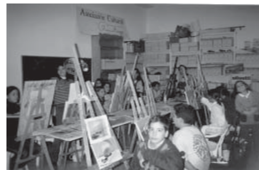
Asistentes a los Talleres de la Asociación.