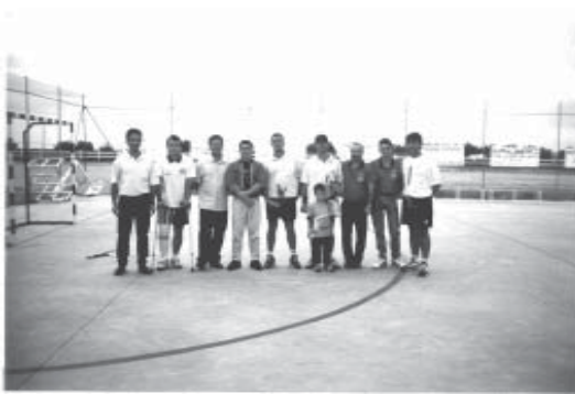
En el centro, con sus respectivos trofeos, el campeón y el subcampeón del torneo.

Agradecer nuevamente la colaboración de todos y anticipar que en el próximo número de este periódico informaremos del desarrollo del I Torneo de Tenis de Dobles de la Asociación Deportiva Juanote.