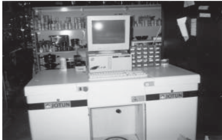
Mas de 10.000 colores gracias a esta maquina.