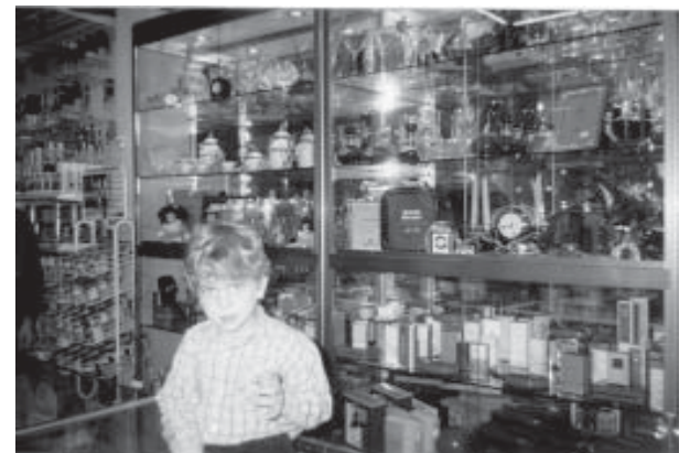
Interior Pinturas Mariano